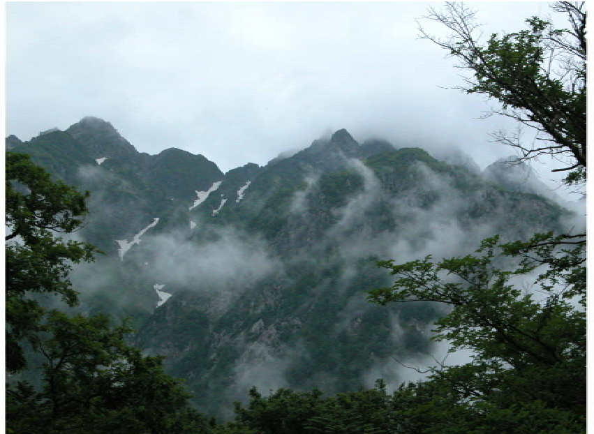
左が明神岳、右が前穂高岳かな?