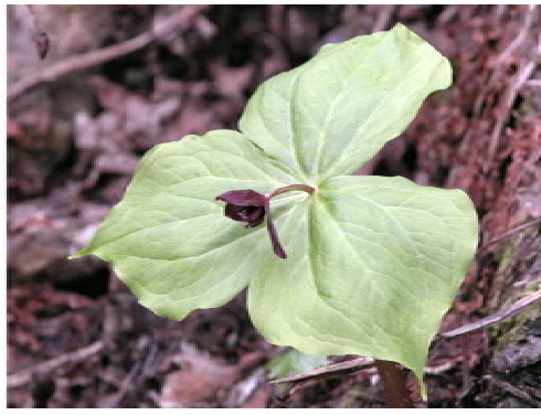
ミヤマエンレイソウ