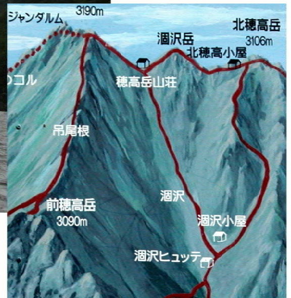
涸沢岳は見えないが、小槍が見える