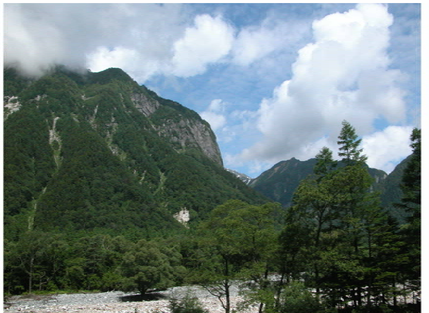
屏風岩 これからこの右側を回りこんで行くのだ(9時4分)