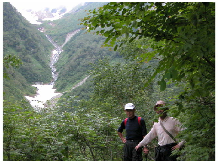
雪溪を見下ろす高さまで来たぞ(11時50分)