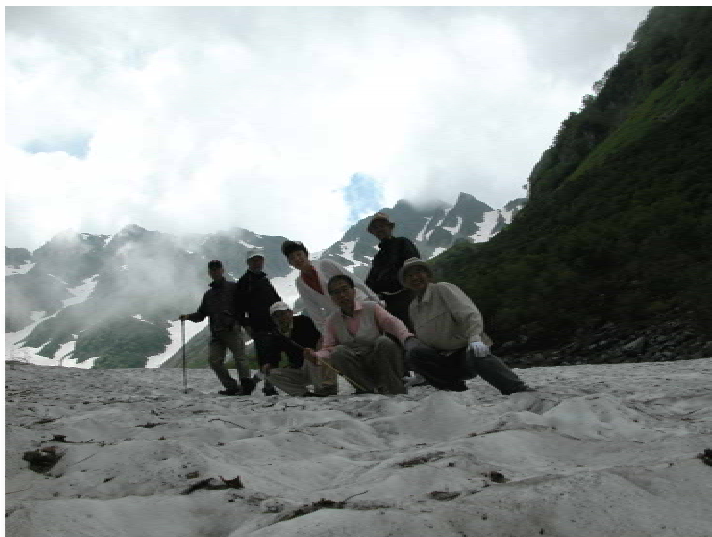
カメラが斜め? いいえ雪の斜面ですべるから踏ん張っているんです