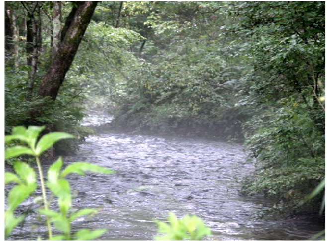
朝もやの立つ徳澤園脇の川