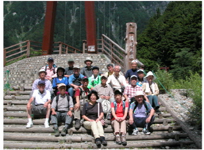
横尾大橋にて、3グループに分かれた 一つは涸沢カールの見えるところまで、 槍ヶ岳が見えるところまで、 三つ目が槍見河原あたりでのスケッチする (9時30分)