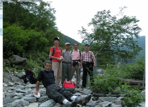
本谷橋(10時55分)ここからは登りだ 一休み。。ここで2つに分かれた