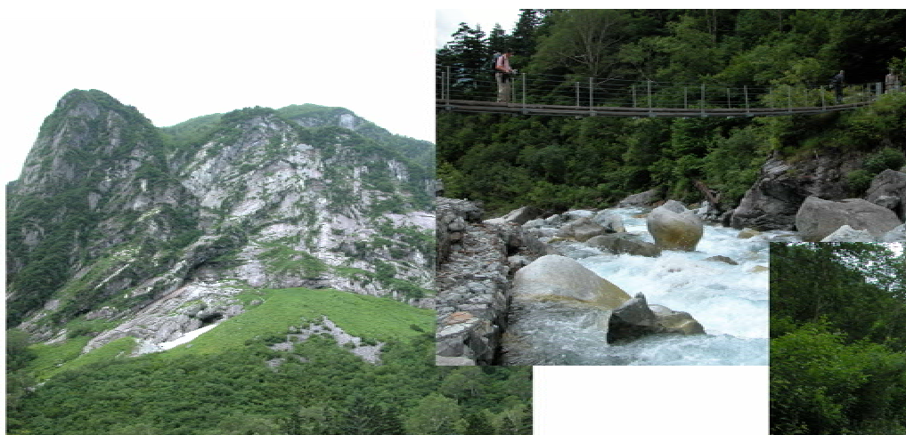
裏側へ回り込んだ(10時45分)