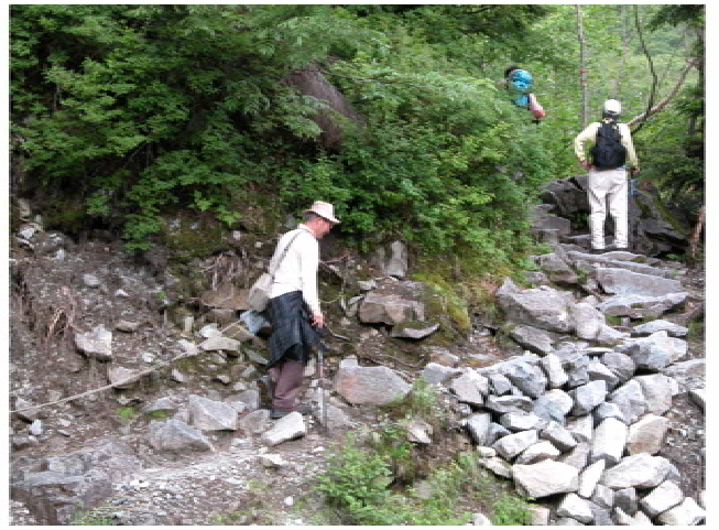
足元に気をつけて！ 荷物は軽いが、空気が薄くなってきたのかな？ 杖は本当にありがたいね！