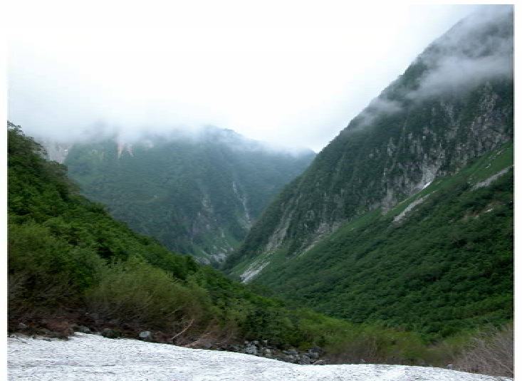
屏風岩と同じ高さだ! 天気に恵まれ感激!