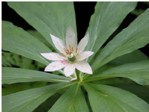
キヌガサソウに見とれて一休み12時10分)