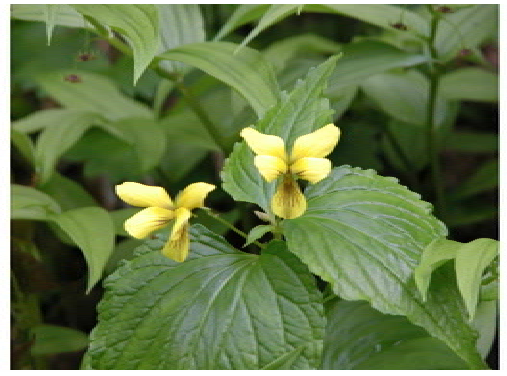
オオバキスミレ (13時35分)