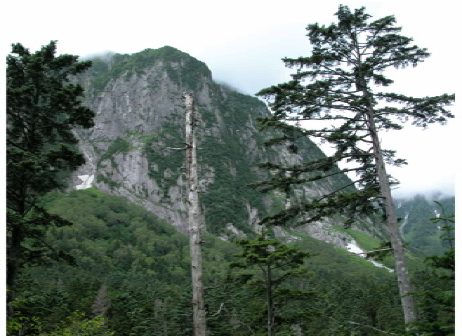
屏風岩の正面に回りこんできた(10時18分)