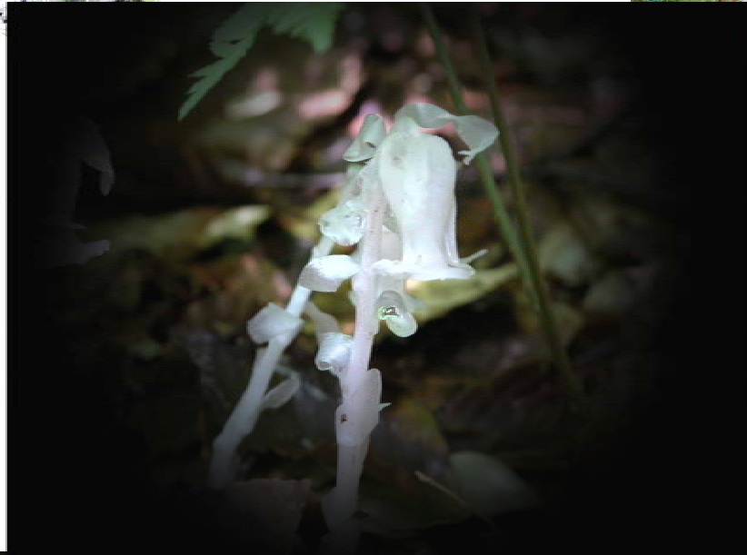
ギンリョウソウ 腐生植物 葉緑素の無い 植物