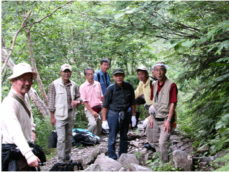
すごい急坂 一休み(11時20分)