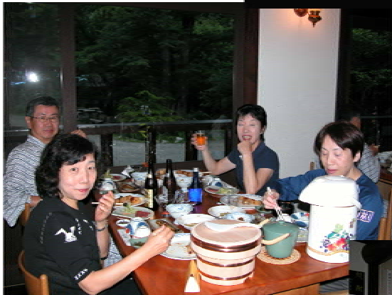
全員無事徳澤園に戻り、夕食