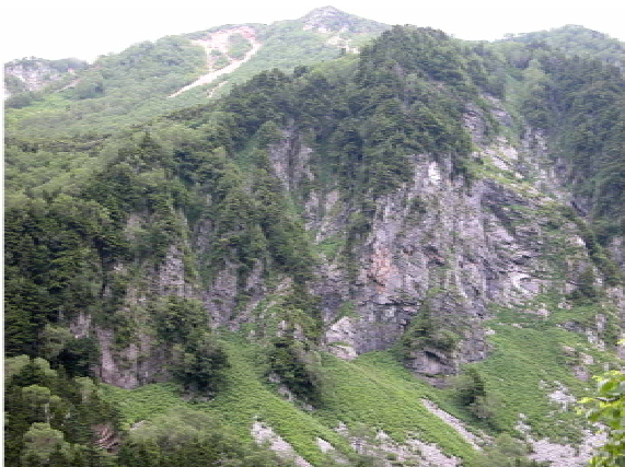
ずいぶん高いところまで上がってきた 眼下に雪溪が見える(11時35分)ここで2つに分かれた。7人で目的地カールの下まで